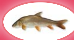
Barbeel - 30 cm