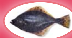
Bot - 20 cm