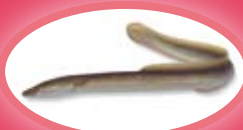
Paling - 28 cm