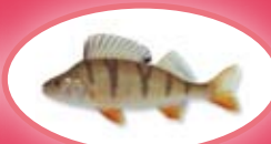
Baars - 22 cm